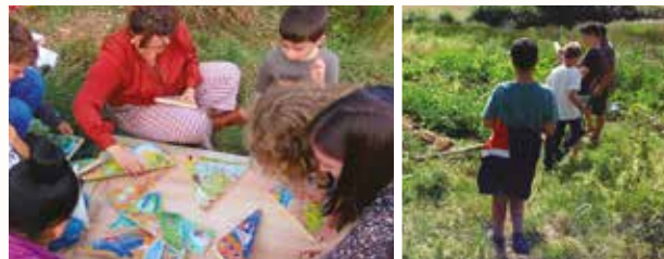
2 heures - groupe de 4 à 10 pers. - adapté à l'âge

Découvrez les grands principes de l'écologie et notre jardin via un jeu, une chasse au trésor et ses 12 énigmes.