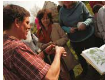
2 heures - groupe de 8 à 25 pers.